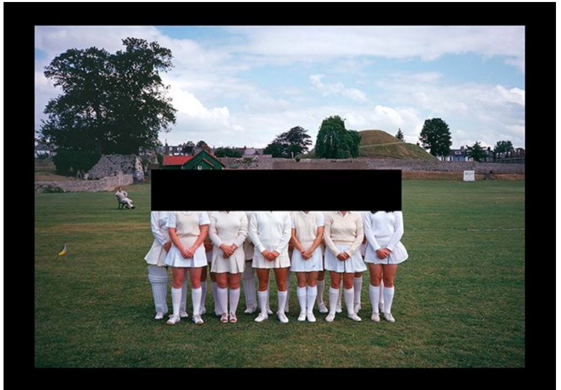
מתוך "רגעים חלקיים"

(found photography) בבריטניה. הענין שלי בדימויים של יומיום בריטי נובע גם מתובנות שהיו לי ביחס לחיים לרגעים משפחתיים, בחברה שבה ההפרדה בין פנים לחוץ מאוד מובחנת. אחת העבודות שנולדו מתוך זה היא "רגעים חלקיים" שממנה לקוח הדימוי שבאוסף מכון שפילמן.